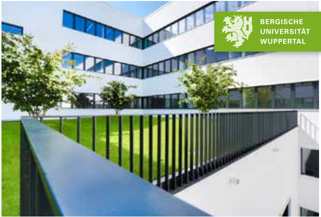
Bergische Universität, Gebäude V + W (Maschinenbau, Sicherheitstechnik, Chemie und Biologie)

Die Bergische Universität Wuppertal ist eine moderne und junge Hochschule im Herzen Nordrhein-Westfalens. Studieren in Wuppertal heißt: Spannende Inhalte, ein gut organisiertes Studium, hervorragende Betreuung durch motivierte Professor*innen sowie exzellente Karrierechancen.